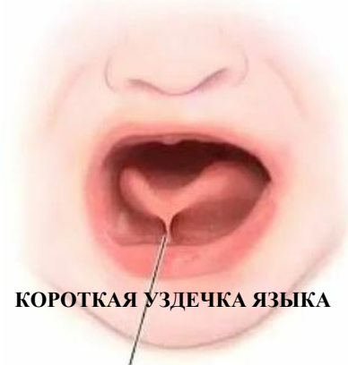
КОРОТКАЯ УЗДЕЧКА ЯЗЫКА

Если Вы обнаружили у своего ребёнка короткую подъязычную связку (уздечку) в дошкольном возрасте есть два пути решения данной проблемы :