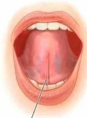
УЗДЕЧКА ЯЗЫКА В НОРМЕ